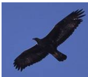
Aigle royal

Le Massif des Bauges est un massif préalpin calcaire de moyenne altitude dans lequel l'histoire géologique a façonné de nombreuses falaises et escarpements rocheux structurant le paysage. C'est dans ces habitats rupestres que nichent 2 espèces patrimoniales de rapaces : l'aigle royal (7 couples) et le faucon pèlerin (20 couples).