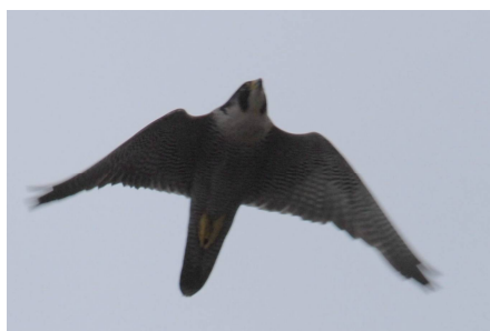
Faucon pèlerin

Dans un souci de protection et de respect des sites de nidification, le Parc naturel régional du Massif des Bauges met en œuvre depuis 2004 un schéma de cohérence sur les activités sportives qui fréquentent ou utilisent ces milieux : escalade, vol libre et vol à voile.