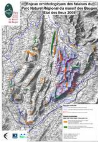
Carte des enjeux ornithologiques

Falaises à enjeux forts : sites de présence avérée d'au moins un des trois rapaces d'intérêt communautaire ( Aigle royal , Faucon pèlerin , Hibou grand duc )